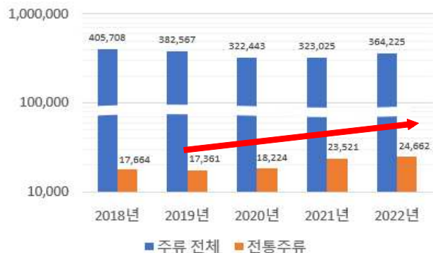
< 국내 주류·전통주 수출액 >