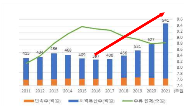
< 국내 주류·전통주 출하액 >

* 민속주는 100억원 내외로 정체, 지역특산주 중심으로 대폭 성장 ('16: 292억원 → '21: 831)