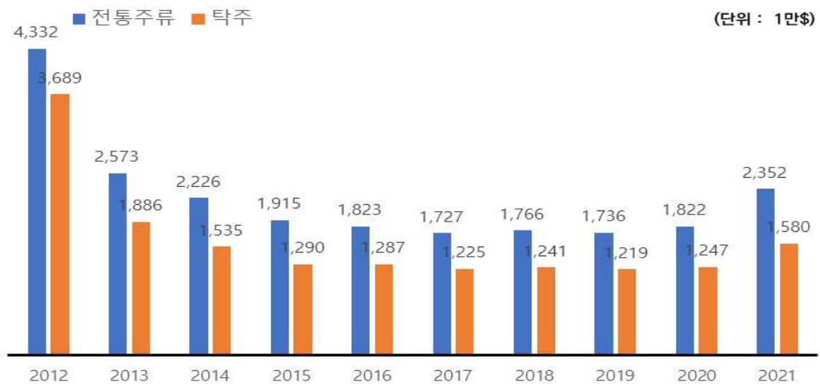
전통주류 수출액 추이(2012~2021)

□ (산업구조) 매출액 10억원 이하 업체가 전체의 90.7%(全 제조업 67.4), 종사자 4인 이하 사업장은 80.9%(全 제조업 73.4)로 영세, 소수 기업이 시장 주도