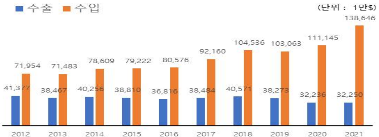
주류 수출입액 추이(2012~2021)

* 주종별 수입액 : 와인(581백만불, 42%), 맥주(223, 16), 위스키(175, 13)